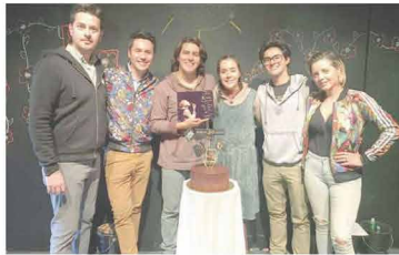
Con la obra "Kiwi", ganadora de la Muestra Estatal de Teatro 2018, se tuvo la celebración internacional de las artes escénicas en la región.