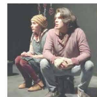
El montaje, recomendado para jóvenes a partir de los 13 años, se unió a la celebración del Día Mundial del Teatro para la Infancia y la Juventud con una temporada para escuelas.

sus primeras 30 representaciones, dando lectura al mensaje de celebración que se lee en todo