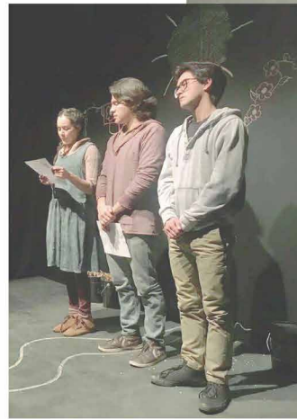
Los jóvenes del elenco de la obra "Kiwi", hicieron lectura de la Carta del Día Internacional de Teatro 2019.