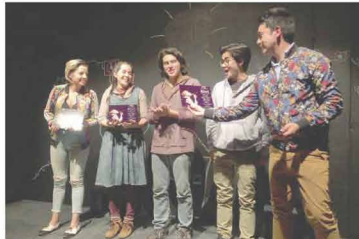
La tarde del domingo que el montaje festejó sus primeras 30 representaciones jurto a un festivo público juvenil.

que el día 27 de marzo tendrá su celebración internacional. Un domingo feliz, juvenil de artes escénicas el íntimo escenario del Teatro Las Tablas de esta ciudad. "Tener nombre de fruta o de verdura, no te cambia, pero como que te limpia", reza el credo promocional de la obra que está dentro de la programación anual del foro apoyada por el Fondo Nacional para la Cultura y las Artes.